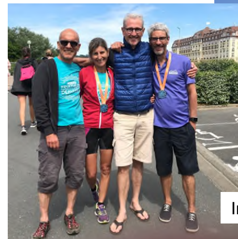
Brochette de touristes à Deauville!