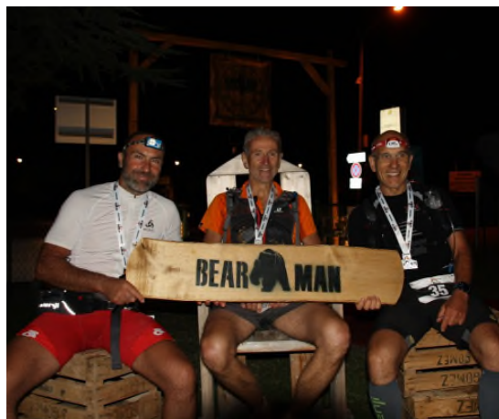
Jusqu'au bout de la nuit !