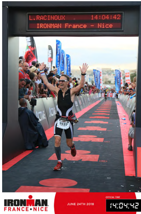
Ironman super lolo HEUREUX !